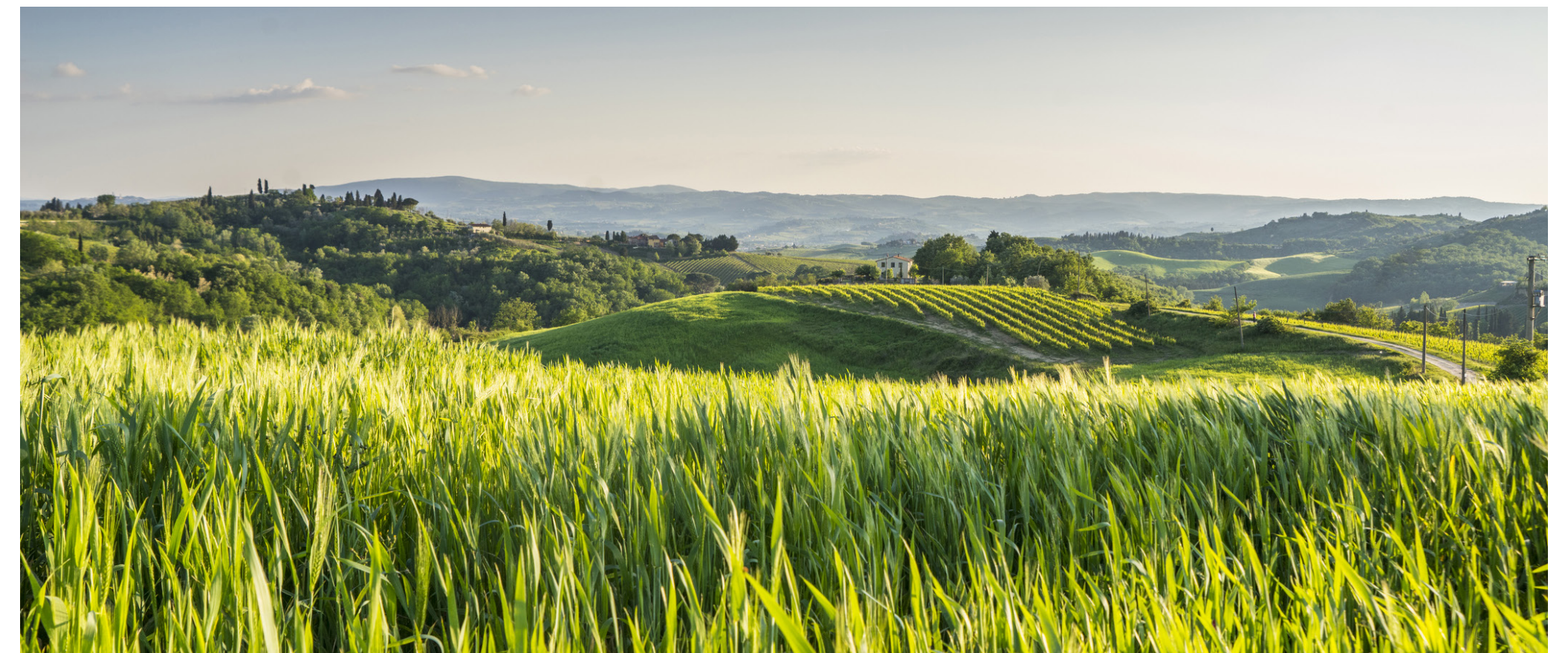
นโยบายการสื่อสารความยั่งยืนของกลุ่มบริษัท