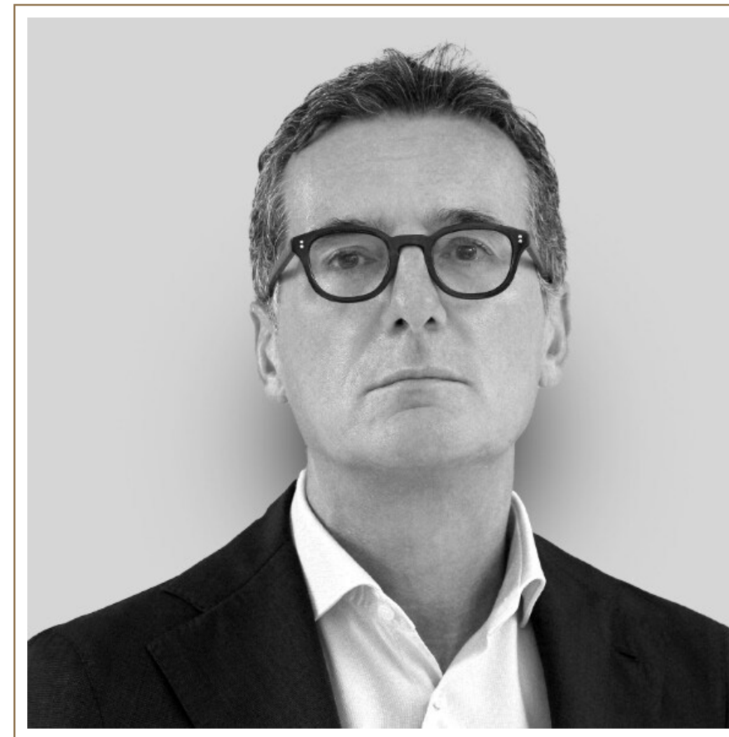
● Francesco MILLERI ประธานกรรมการและประธานเจ้าหน้าที่บริหาร

ความสำเร็จในอนาคตของเราขึ้นอยู่กับความมุ่งมั่นทางจริยธรรมของทุกคนในกลุ่มบริษัท